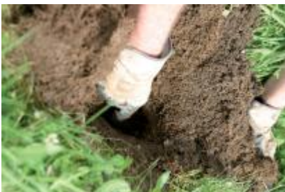
Mit etwas Übung ist die Falle in drei Minuten aufgestellt. Der Gang wird mit einem Löffel freigelegt