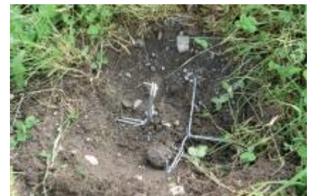
Ob die Falle ausgelöst wurde, ist ohne großen Aufwand sofort zu erkennen. Das spart Zeit

Die Original Wolf'sche Zangenfalle ist bei uns um € 4,00 das Stück erhältlich und kann auch über Telefon bestellt werden !